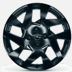
215/60 R17 Gloss black - CWAV