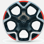
215/55 R18 Tri Color Red - CWAX