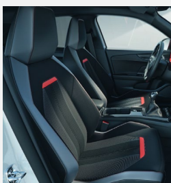
Halvläderklädsel, Focus Red - TAWF