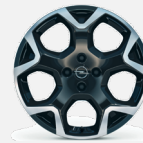
215/55 R18 Bi Color Black - CWAW