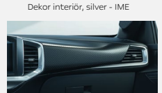
Dekor interiör, silver - IME