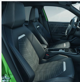
Alcantara klädsel, Jet Black- TAWJ